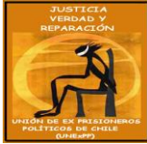
UNIÓN DE EX PRISIONEROS POLÍTICOS DE CHILE UNEXPP de Chile