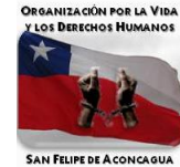
AGRUPACION DE EX PRISIONEROS POLITICOS SAN FELIPE