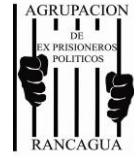
AGRUPACION DE EX PRISIONEROS POLITICOS RANCAGUA