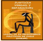
UNIÓN DE EX PRISIONEROS POLÍTICOS DE CHILE UNEXPP de Chile