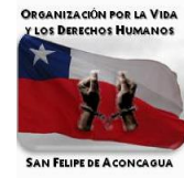
AGRUPACION DE EX PRISIONEROS POLITICOS SAN FELIPE

Comentario: En resumidas cuentas el secreto se mantiene así casi en las mismas condiciones de la Ley 19.992 (1). Del mismo modo se acepta a los titulares darlos a conocer o proporcionarlos a terceros por voluntad propia. La invocada “confidencialidad” vulnera las convenciones contra la tortura.