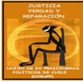
UNIÓN DE EX PRISIONEROS POLÍTICOS DE CHILE UNExPP de Chile