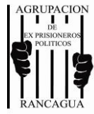
AGRUPACION DE EX PRISIONEROS POLITICOS RANCAGUA